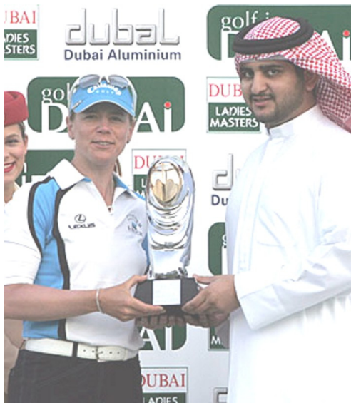
Abb. 3 Annika Sörenstam, weltbeste Golferin, jahrelang Nr. 1 bei der LPGA, hier bei einem Turniersieg in Dubai.

Von den meisten wurde meine Tätigkeit als Einmischung in unerlaubte Bereiche gewertet. Daher sind meine diesbezüglichen Vorträge in Österreich eine Rarität. In den USA sind sie schon fester Bestandteil einer Golf- und Fortbildung. An der Annika Academy in Orlando, die Golf-Academy der weltbesten Golferin, wurde mit mir ein „Healthy Back-Program“ entwickelt. Für mich heute ein wichtiger Qualitätsnachweis meiner Tätigkeit. Dort zählt das Können.