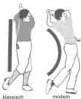
Klassische und moderne Technik im Finish (mod. nach WIREN 1976 [3])

Mittlerweile hat auch bei den Golflehrern ein Umdenken stattgefunden. Es steht